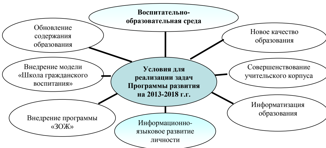
Рис. 4.1.1. Модель программы развития школы

Совет школы утвердил программу развития образовательного учреждения на 2013 - 2018 гг., единогласно выделив ее приоритетное направление: информационно-языковое развитие личности. Модель программы развития школы представлена на рис. 4.1.1.